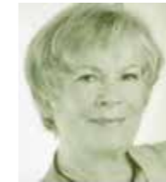
Ruth von Braunschweig